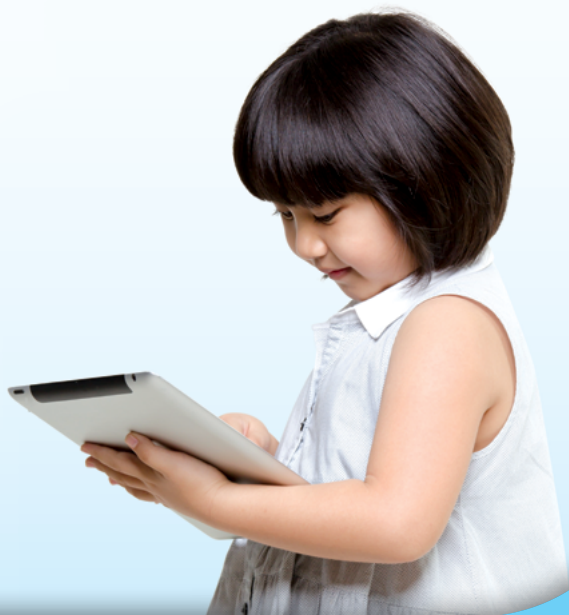
眼科部 | 眼科中心